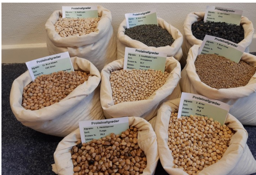
Proteinafgrøder fra netværksaktør Foods Bornholm

Læs mere om GUDP's projekter på www.gudp.dk