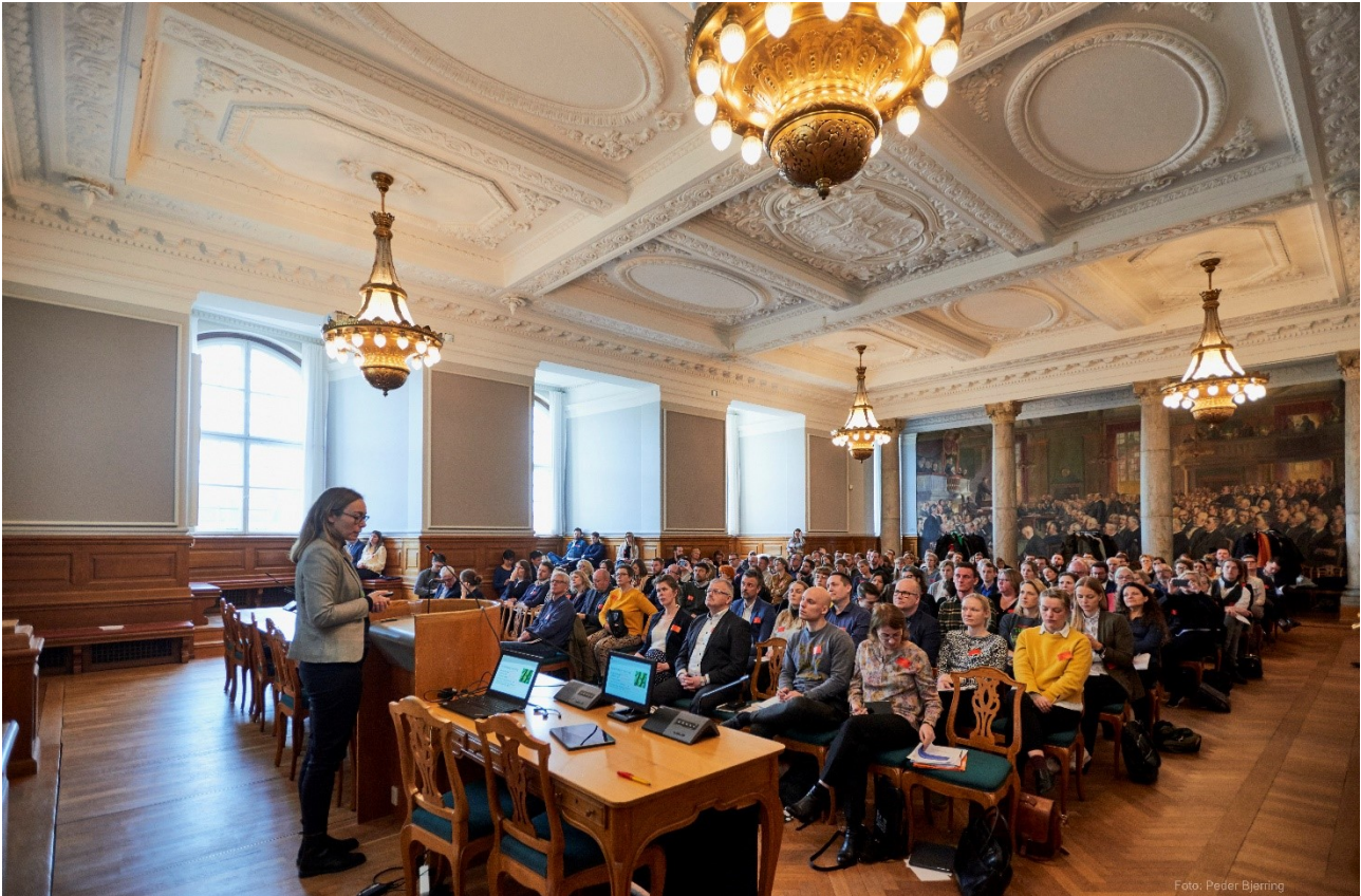
Konference på Christiansborg februar 2020 i regi af netværket

Netværk for Fremtidens Planteproteiner i Danmark, Netværk for Fremtidens Planteproteiner, Danish Network for Plant Proteins.