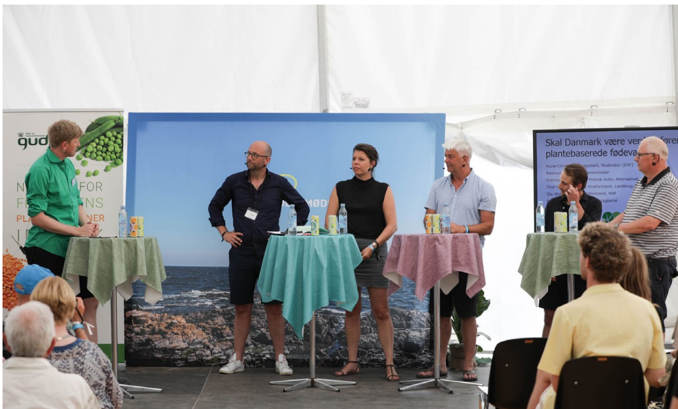
Debat på Folkemødet 2021 i regi af Netværk for Fremtiden Planteproteiner i Danmark

Eftersom der i forvejen er en forandring i gang blandt især de unge, vil det være vanskeligt at opgøre, præcis hvor stor en del af en fremtidig forandring i forbrug og produktion, der kan henføres til nærværende projekt.